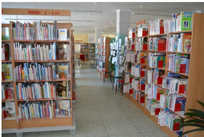
Dětské oddělení s červenými knižními zarážkami

Jarní uzavření knihoven jsme využili jako příležitost dát si do pořádku knižní fond. Dělali jsme to skutečně důkladně. Brali jsme do rukou jednu knihu za druhou a posuzovali, zda potřebuje opravit, nově zabalit nebo jestli už nastal čas na její vyřazení. Vyřazovali jsme knihy zastaralé, knihy, které si čtenáři delší dobu nepůjčili, ale hlavně knihy opotřebované. K této práci jsme přistupovali poctivě; ověřovali jsme frekvenci půjčování, zvažovali jsme důležitost knihy a jedinečnost informací v ní a také její opotřebovanost. Potom jsme ji buď vrátili do volného výběru, přeřadili do skladu nebo vyřadili. Důležitým faktorem při rozhodování byla samozřejmě i skutečnost, zda je kniha zařazena do tzv. zlatého fondu literatury. Řadu opotřebovaných knih jsme také znovu nakoupili. Přeznačovali jsme, dávali nové obaly, ale také rovnali, aby se čtenářům v knihovně líbilo. Regály jsme doplnili novými zarážkami. Na dětském oddělení mají červenou barvu, na dospělém oranžovou (krásná literatura) a modrou (naučná literatura) a ve studovně zelenou. Celkem jsme odepsali 6 753 knih, z toho 5 485 právě při jarním uzavření knihovny.