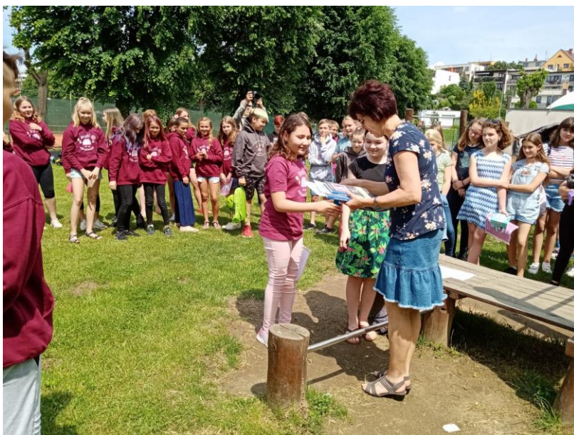
Pátáci z 1. ZŠ Sedlčany za námi přišli na hřiště

Malí spisovatelé, Malí ilustrátoři (4. třídy ZŠ)