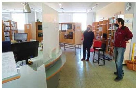
Chráníme vás i nás.

Přemýšlely jsme, jak pomoci seniorům a handicapovaným, čili nejohroženější skupině obyvatel. Být doma je sice fajn, ale není dobře, když se z domova stává tak trochu vězení s omezenou možností jít ven, za známými, za kulturou nebo do klubů a spolků. Společníkem pro takové chvíle může být kniha, a protože není možné si ji přijít vybrat do knihovny, nabízíme možnost donášky knih domů. Služba je určena čtenářům handicapovaným a těm, kterým je 70 let a více. Donáška se řídí pravidly návaznými na obecná doporučení