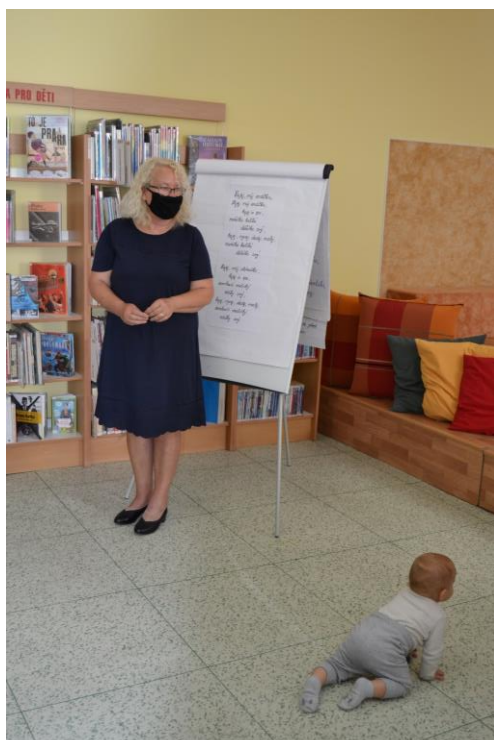
Setkání miminek v rouškách...

Setkání miminek aneb Den za dnem s miminkem je slavnostní program, na který jsou do knihovny zvány rodiny sedlčanských miminek. Navazuje na něj ještě další setkání, které nese název Rok s miminkem . Program Setkání miminek aneb Den za dnem s miminkem se uskutečnil 1x; druhý program se v roce 2020, bohužel, neuskutečnil.