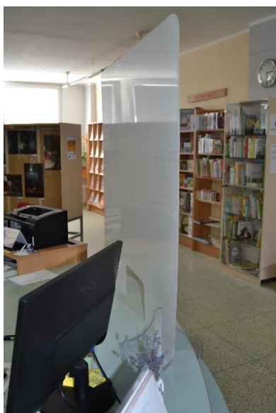
Plexi zábrana na výpůjčním pultě

Po celý rok jsme dodržovali veškerá nařízení spojená s pandemií. V dubnu 2020 jsme zakoupili bezdotykový dezinfekční stojan a nechali vyrobit mobilní plexi zábranu a tři plexi zábrany na výpůjční pult. Mobilní zábrana nám posloužila v době knižní karantény, ale i později jako výdejní okénko.