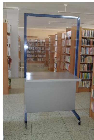
Mobilní plexi zábrana