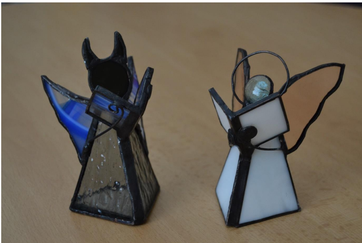
Čtenář anděl a čtenář čert – autorka Šárka Vinařová