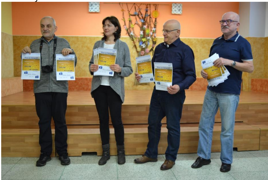
Vítězové fotografické soutěže

Pivo ve fotografii (fotografická soutěž pro fotokluby Uran Příbram a FotoFlegmatici Sedlčany)