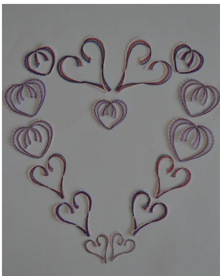
Paličkovaná srdíčka za roušky – dárek našich krajkářek