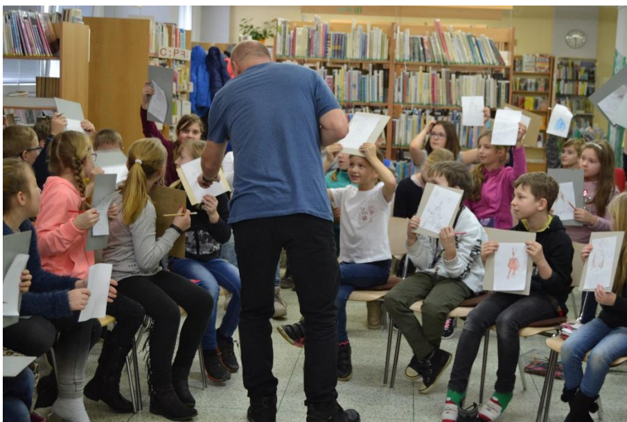
Děti při workshopu tvořily a byly akční