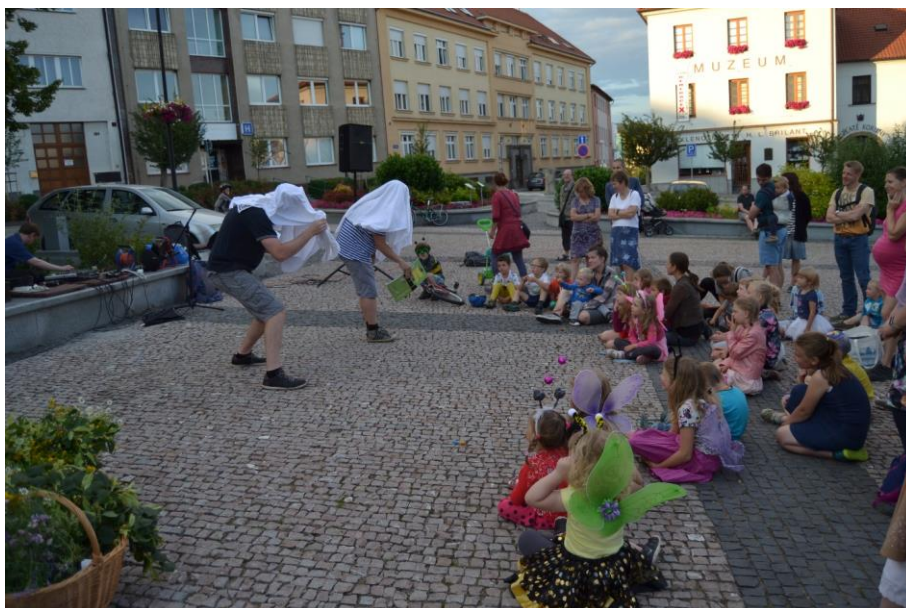
LiStOVání poprvé na náměstí

Čury, mury, žádné chmury – o tom, že číst se dá i venku jsme přesvědčovali rodiče a děti na Cihelném vrchu.