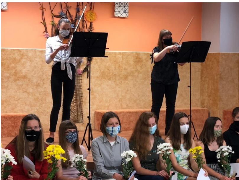
První vernisáž po jarní pandemické vlně

Výstava absolventských žákovských prací výtvarného oboru – výstava ZUŠ Sedlčany