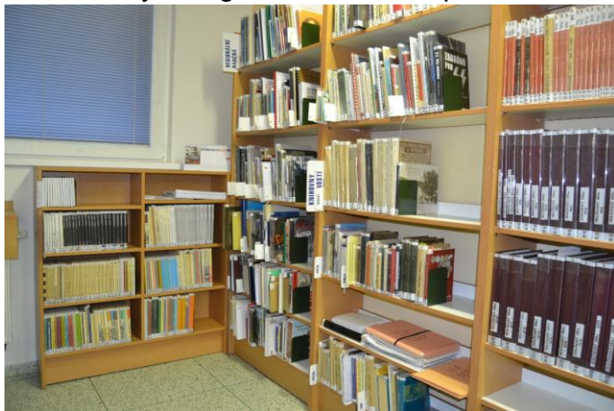
Regionální literatura v novém regálku

V souvislosti s regionálními periodiky a fondem studijní regionální literatury jsme nechali vyrobit regálek do studovny. Rozšířila se nám tak možnost pro uložení archivovaných regionálních knih a periodik.