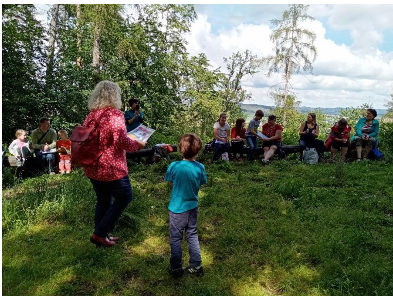
Odměny a diplomy předáváme poprvé v Čítárně na Cihelném vrchu