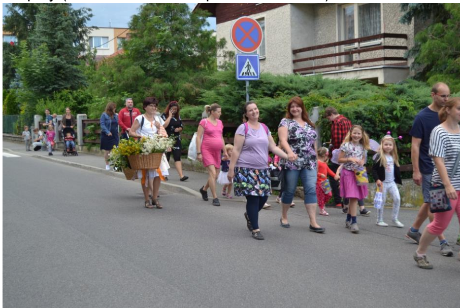
Vycházíme od knihovny se skvělou náladou