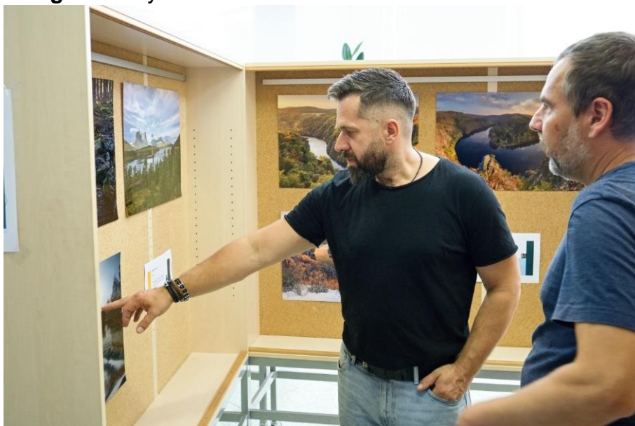
FotoFlegmatici hodnotí při vernisáži konkurenci

Fotografie – výstava fotoklubu Uran Příbram.