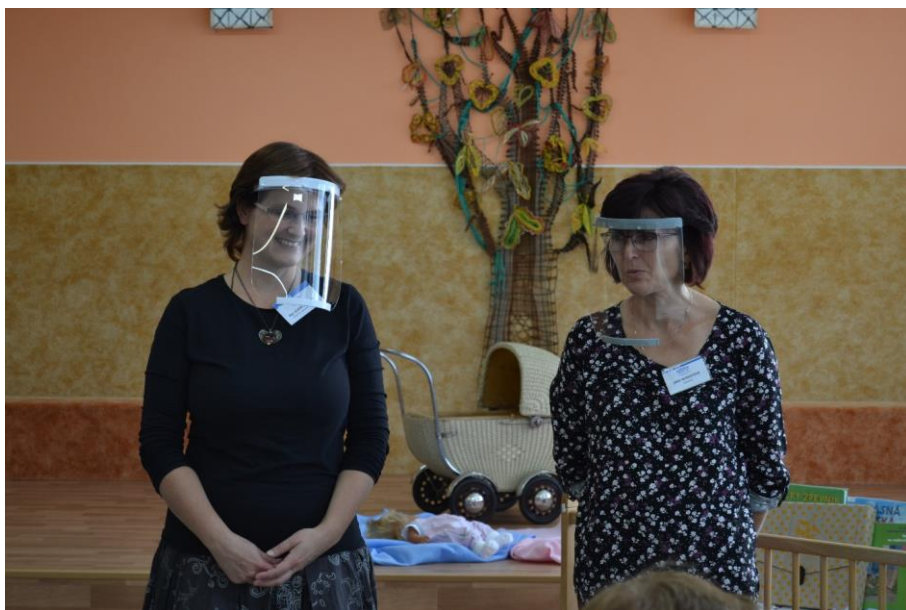
... a se štíty od pana Vinaře