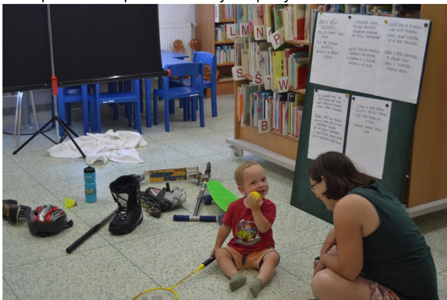
Sportování bavilo i ty nejmenší...

Sportem ku zdraví – program pro rodiny s dětmi. Hravé dopoledne plné básniček, her a písniček inspirované různými sporty.