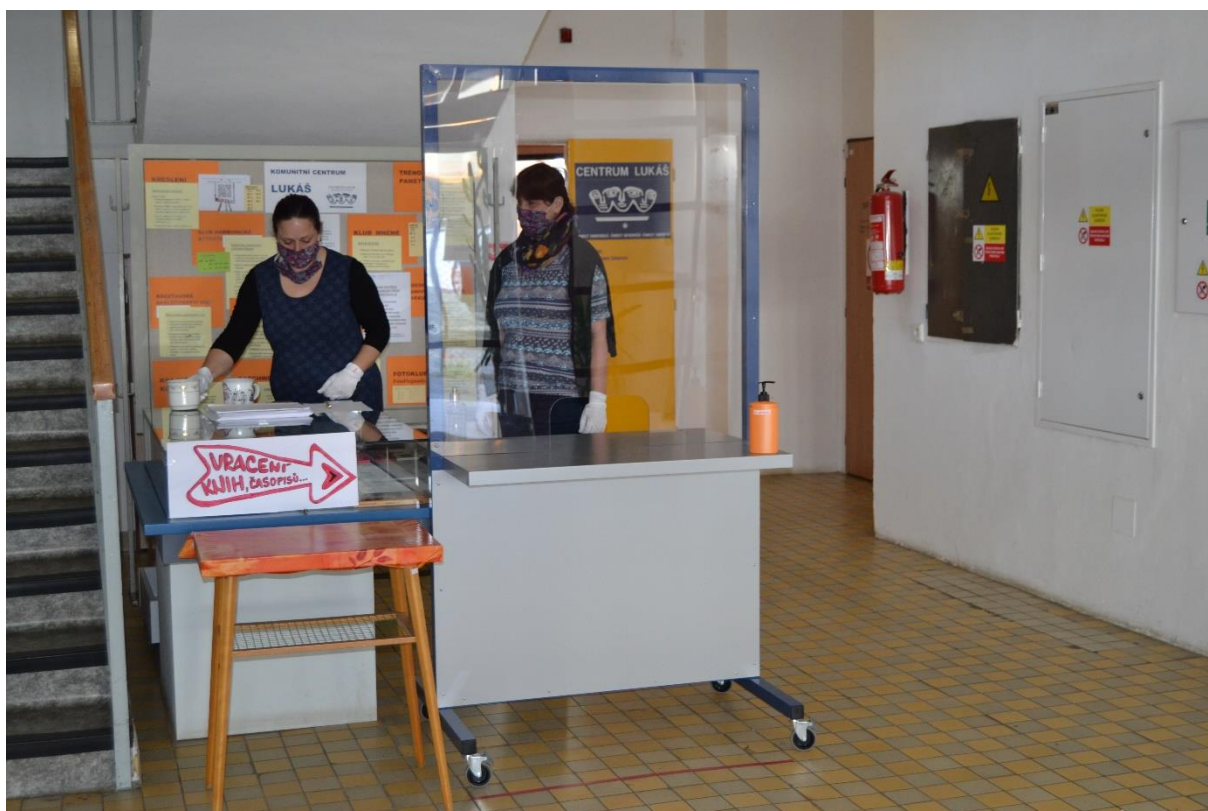
Otevření knihovny 4. 5. 2020 – knižní karanténa