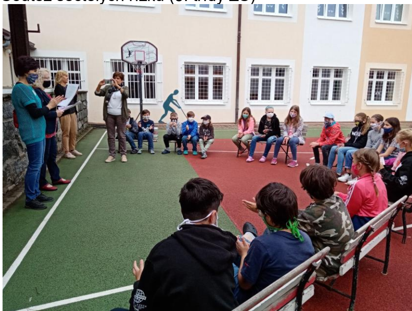
Poprvé jsme ocenění nepředávali v knihovně. Dvůr 2. ZŠ Propojení Sedlčany

Prezentace lehce – „Fake news“ (ZŠ, SŠ) Čtenářská liga – „Fakt hustý týpci“ (děti od 0 do 15 let) Soutěž sečtělých řízků (5. třídy ZŠ)