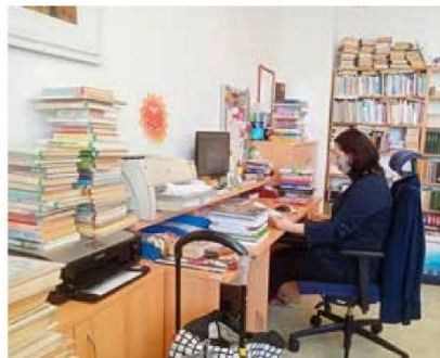
Zapisujeme, přepisujeme, odepisujeme.